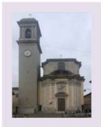
C.f 1 a - Chiesa di S. Giovanni Evangelista (Canonica d'Adda)

La scelta della Chiesa di S. Alessandro come quella di rappresentanza del centro liturgico è stata determinata dal fatto che sia in grado di accogliere tutta la Comunità Pastorale di S. Giovanni XXIII, quindi adunare il maggior numero di fedeli ed ospitare eventi come la visita di alte cariche ecclesiastiche.