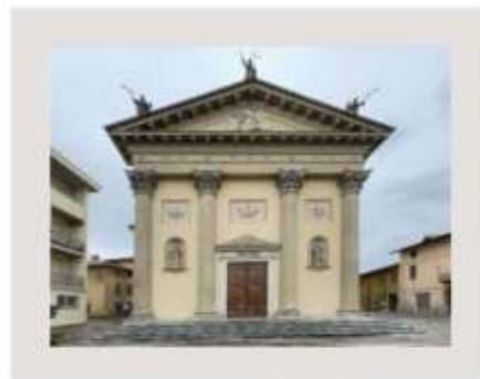
P.f 1 a - Chiesa di San Michele Arcangelo (Pontirolo Nuovo)